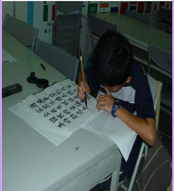
書法比賽-二代健保宣導