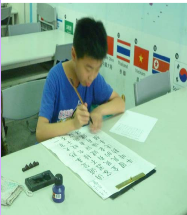
書法比賽-二代健保宣導