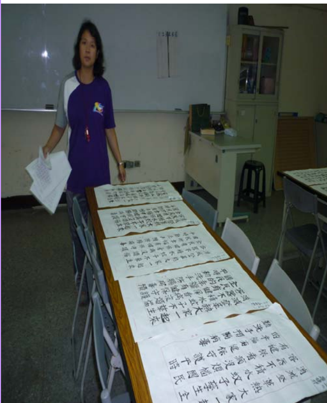
二代健保作品展示